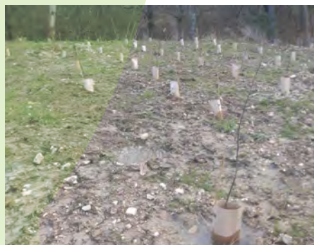
Ci-dessus : Plantations aux rosières

Des arbustes ont également été plantés pour embellir la devanture de la salle Clair-Vigne. Ainsi les agents ont placé, entre autres, des abélías, des céanothes, du romarin et des photinias.