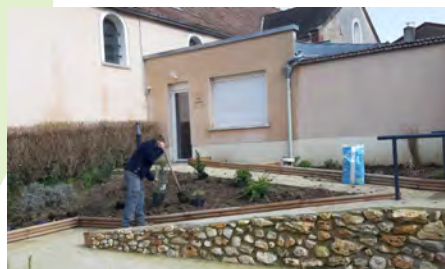
Ci-dessus : Plantations devant la salle Clair-Vigne